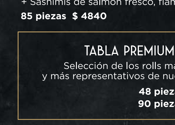
TABLA PREMIUM SUSHIMI Selección de los rolls más pedidos y más representativos de nuestra carta 48 piezas $ 3250 90 piezas $ 5380

TABLA VEGGIE (TODO VEGETARIANO) 18 piezas - Crunchy veggie (mitad con topping hummus de garbanzos), caribbean (mitad c/salsa mango) 36 piezas - 9 caribbean veggie, 9 crunchy veggie, 9 sweet veggie y 9 brasil roll. 18 p $ 990 - 36 p $ 1590