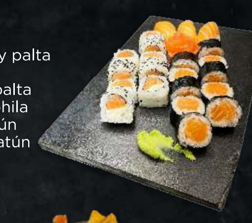
TABLA MOWI (TODO SALMON FRESCO) 10pzas maki salmon, 9pzas phila-salmon y 3 nigiris 22 piezas $ 1320

SINATRA - 48 PZAS Makis de atún rojo y phila + Rolls de salmón fresco, phila y palta envuelto en salmón fresco + Rolls de langostinos, phila y palta + Rolls de salmón ahumado y phila + Nigiris de salmón fresco y atún + Sashimis de salmón fresco y atún 48 piezas $ 2890