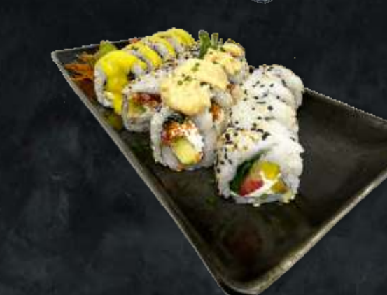
TABLA VEGGIE (TODO VEGETARIANO) 18 piezas - Crunchy veggie (mitad con topping hummus de garbanzos), caribbean (mitad c/salsa mango) 36 piezas - 9 caribbean veggie, 9 crunchy veggie, 9 sweet veggie y 9 brasil roll. 18 p $ 990 - 36 p $ 1590

HOT & FRESH Arrolladitos primavera + bolitas de salmón + 1 NY phila fresco + 1 NY phila hot roll 24 piezas $ 1510